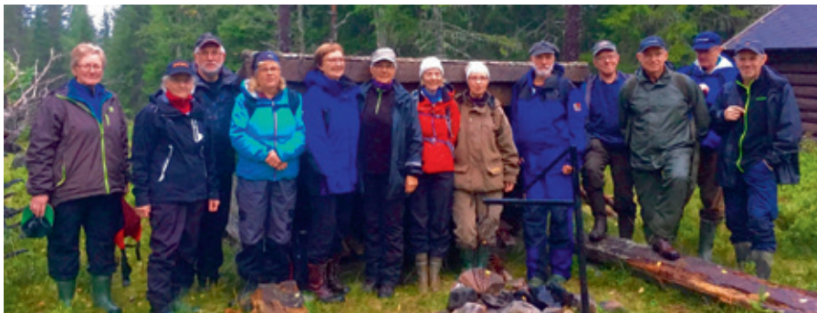
Onsdagstrimmere på Klæbusetern 7. september 2016.

Som i fjor er det i samarbeid med Ogndal Historielag, Ogndal Bygdekvinnelag med flere laget en onsdagstrimkalender og arrangert onsdagstrimturer etter en terminliste. Onsdagstrimmen har vært en suksess! Vi takker alle medarrangører og dyktige kjentmenn. Alle bidrar stort til at trimturene blir en god opplevelse. Dette er fine turer for alle. Totalt er det etter kalenderen i 2016 arrangert 14 onsdagstrimturer, og 4 arrangement på søndager.