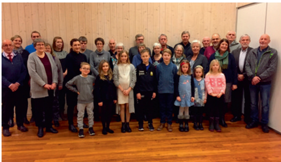
Spreke trimmere på Tjuandagsfesten. Her er mange av de som var på alle de 30 trimkassene/fikk stjerner på pyramidene i 2016. Hurra for alle trimmere i Ogdal!