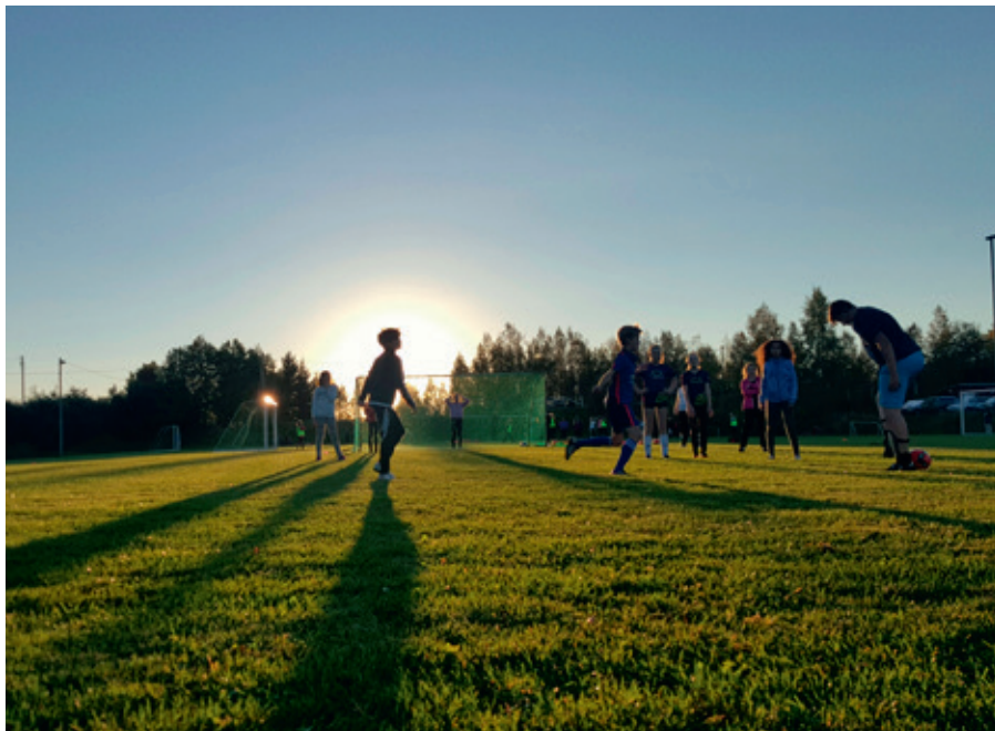
Sommerstemning på Røysing Stadion med fotballgjengen.

For årgangen 2003/2004/2005 har vi i 2016 ikke stilt eget fotballag i serie eller cup. Vi har derimot hatt treninger hver mandag, samtidig med de andre lagene. Ved årets start var vi dessverre ikke nok spillere til å stille lag verken jente- eller guttelag, dvs 7 spiller på hvert lag.