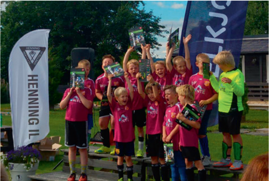
Premieutdeling etter Henningcup