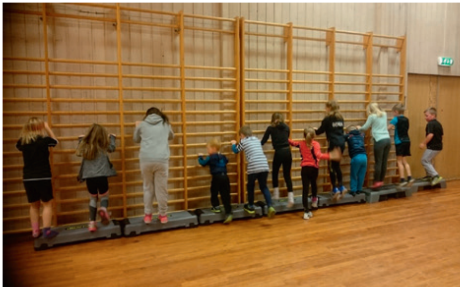
Barna hopper opp og ned fra stepp-kasser, med musikk til.

Hovedfokuset på allidrett er basistrening gjennom et trygt treningsmiljø. Treningene er basert på en blanding av nye utfordringer og repetisjoner for å føle mestring. Dette er i praksis lek og varierte aktiviteter som skal stimulere barnas utvikling og styrke de grunnleggende bevegelsene. På allidretten er det meste basert på lek, men