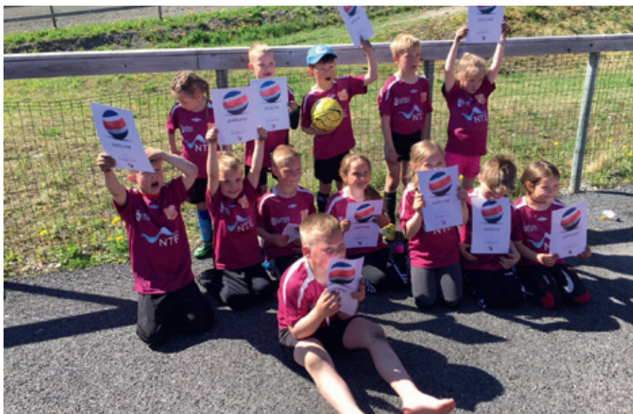
Fornøyd gjeng etter gjennomført Sparbucup