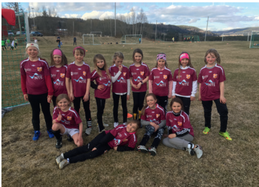
Glad gjeng på trening