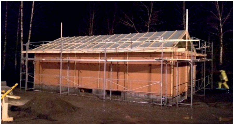
Ny idrettsbu bygges på grusbanen i Røysinga

Hovedstyret har satt i gang byggingen av idrettsbu på grusbanen i Røysinga. Oppføringen av bygget er basert på dugnadsarbeid, og går etter planen. Målet er at den skal være ferdig til sommeren 2021.