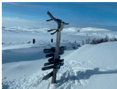
Vandre-kassen ved Lågvassbu 2020

stod på høgda etter Tjurruhølstu fram til 29. mars. Fra 5. april og fram til 3. mai stod kassen ved Lågvassbu. Fra august og ut året var vandre-kassen å finne på Ofte-nåsen. Utrekkspremie deles årlig ut på Tjuandagsfesten. Kassen var godt besøkt også i 2020.