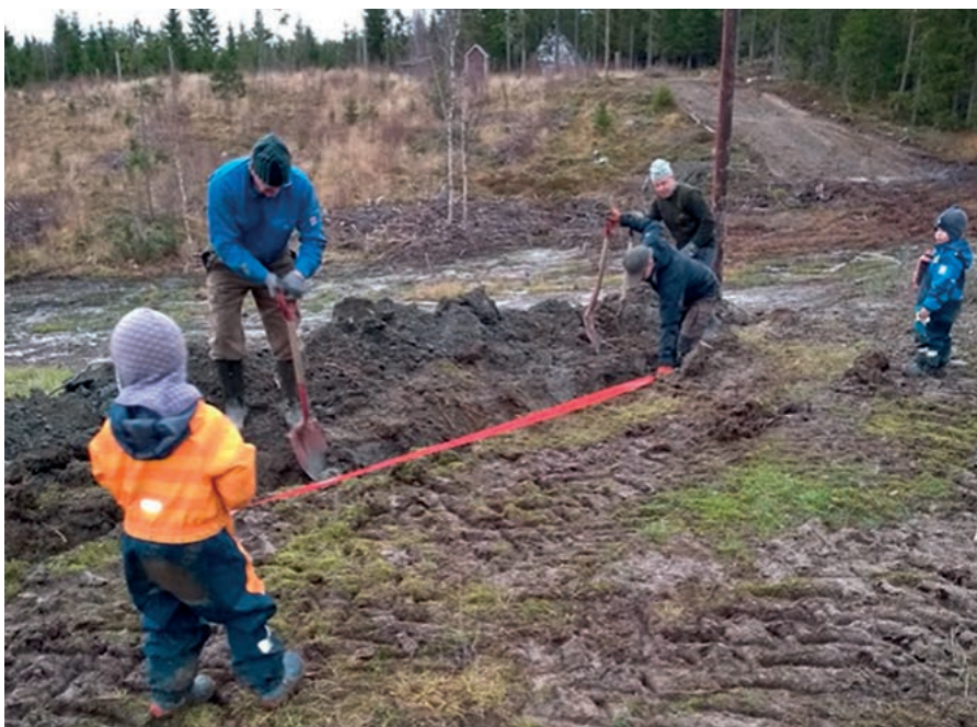
Deler av dugnadsgjengen som bidro under oppsetting av lys i skileikområdet

I sommer og høst har vi fått laga et skileikområde i tilknytning til løypa på Vålen, der det er rydda, planert og satt opp nye lyspunkter. Det er også tilført en ny sløyfe i forbindelse med lysløypa og fult opp noen kuler på grusbanen. Med disse utbedringene har vi et bra anlegg for å skape mye bra skiaktivitet i årene som kommer.