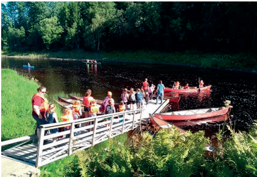
Dag 1, på tur nedover Ognå med kano.