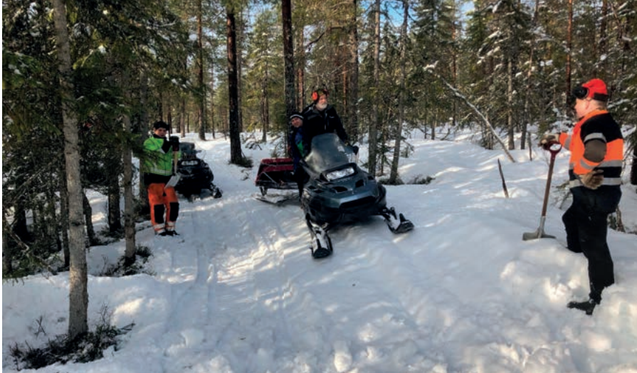
Deler av dugnadsgjengen som bidro under prepareringen av Sellifellrennet.