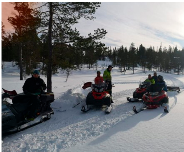
Løypekjøringsgjengen til Sellifjelløypa.