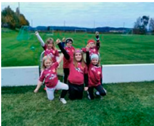
Fra trening med 2015-kullet