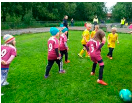
2016-kullet på barnefotballkveld