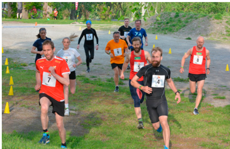
Fra Ogdalsløpet 2022, langløypa