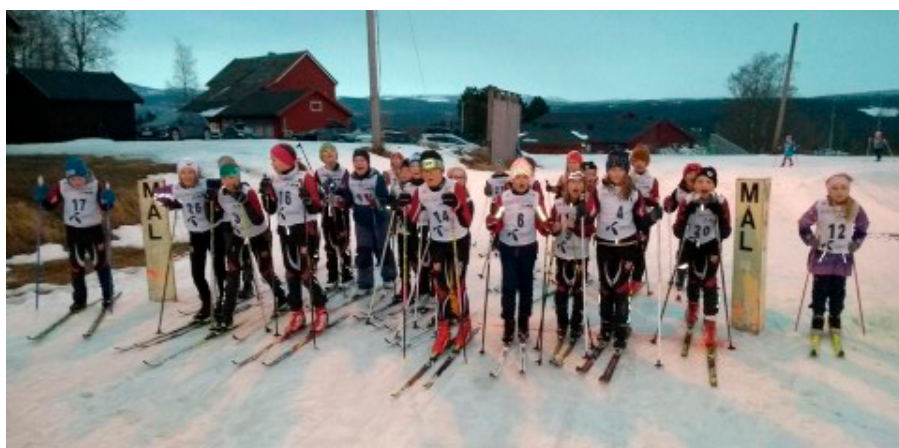
Startfeltet i et av karusellrennene.

I løpet av vinteren fikk vi gjennomført 3 karusellrenn med mellom 30 og 50 deltagere, der det var et godt sprik i alderen fra mange barnehagebarn til noen godt voksne menn. Vi setter stor pris på alle som ser verdien i å ta på seg startnummeret en gang iblant.