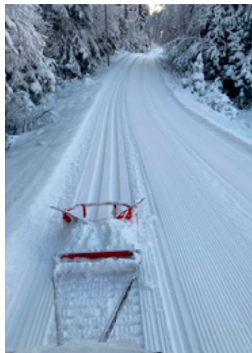
Trikkeskinner i lysløypa i Røysing.